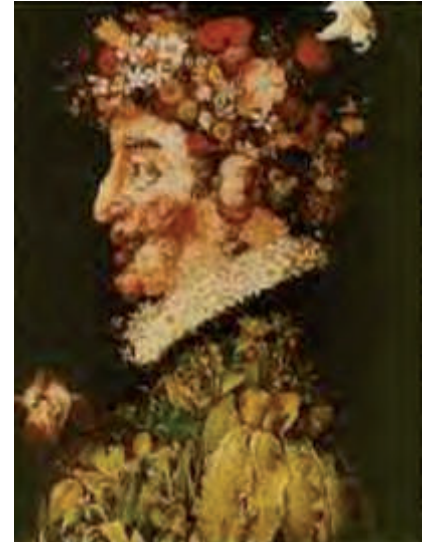
Giuseppe Arcimboldo: Der Frühling